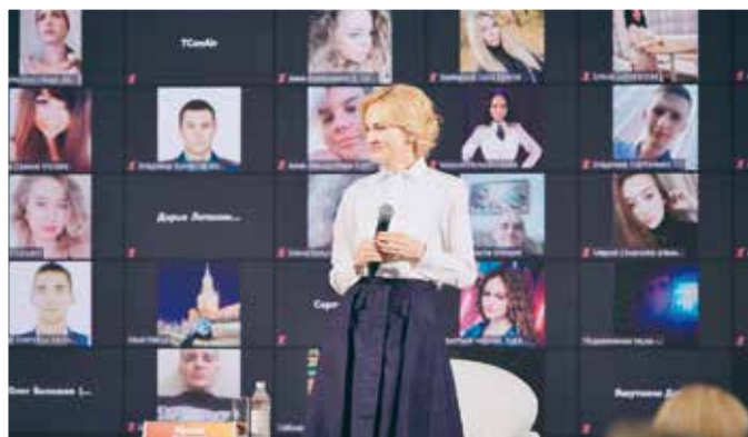
Встреча с участниками Форума «Территория смыслов»