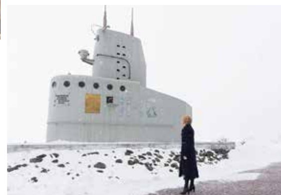
У памятника погибшим морякам-подводникам экипажа подводной лодки «Л-16» в городе Вилючинске