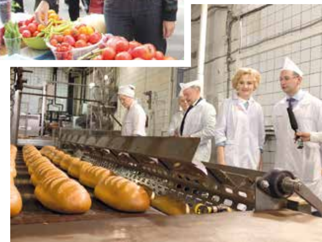
На Московском хлебозаводе