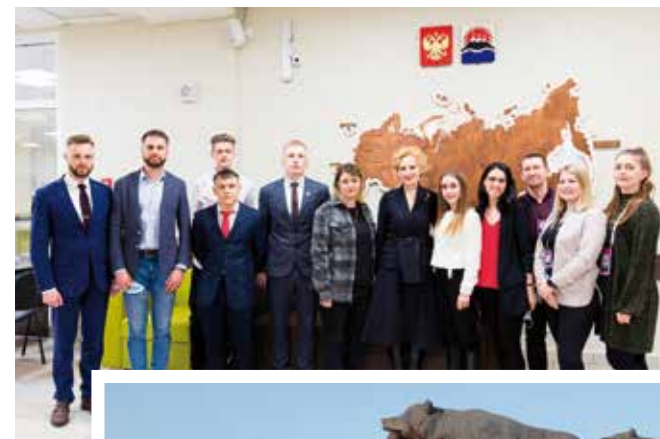
Камчатская молодёжь поддержала проект о доступном целевом наборе