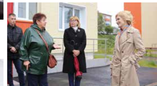
С новосёлами в Елизово