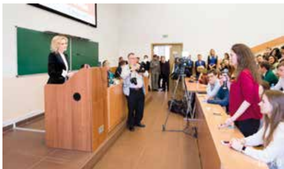
Лекция для студентов Российского экономического университета им. Г. В. Плеханова

Камчатка – первый регион, запускающий проект открытого и доступного целевого набора.