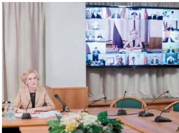
На заседании Совета при Президенте РФ по защите семьи и детей в период пандемии