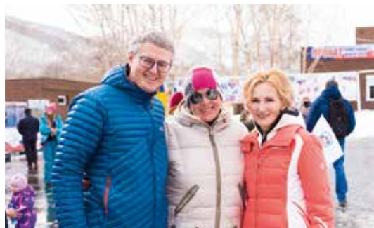
На открытии чемпионата и Кубка России по горнолыжному спорту на горе Морозной