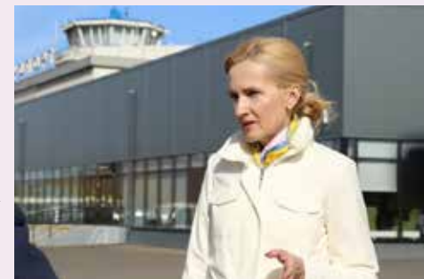
В аэропорту Петропавловска-Камчатского перед отправкой проб с Халактырского пляжа в Москву