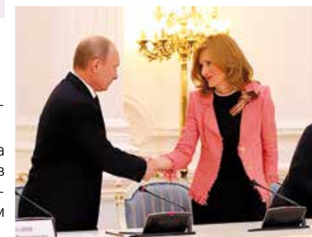
На встрече Президента РФ с руководством Государственной Думы