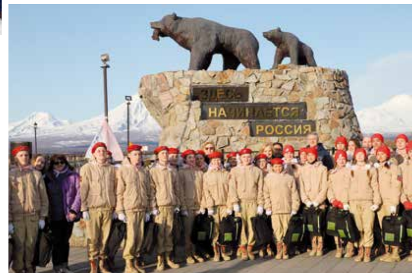
Старт акции «Здесь начинается Россия», организованной госкорпорацией «Росатом»