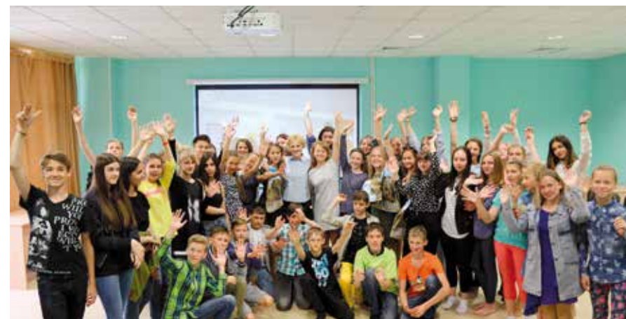
Хорошее настроение в лагере имени Юрия Гагарина