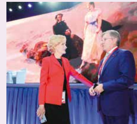
С министром транспорта РФ Виталием Савельевым