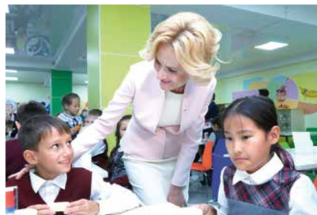
Завтрак в камчатской школе № 40

Ирина Яровая предложила законодательно сделать главным критерием закупок продуктов питания для детей в школах, детских садах, лагерях, больницах и других детских учреждениях качество и безопасность, а не цену продуктов.