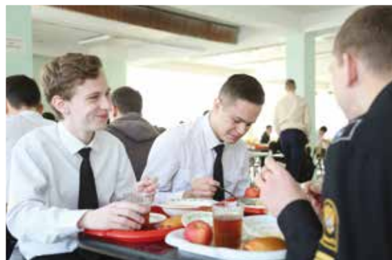
Время обеда в КамчатГТУ