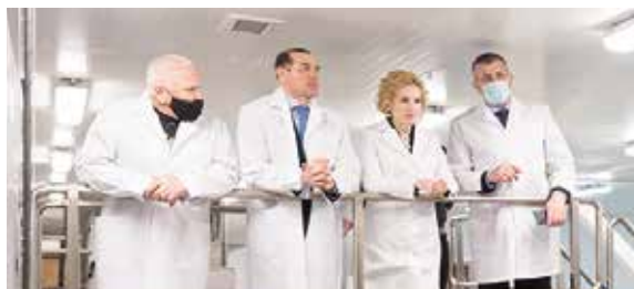
На новом рыбоперерабатывающем заводе рыболовецкого колхоза имени В. И. Ленина