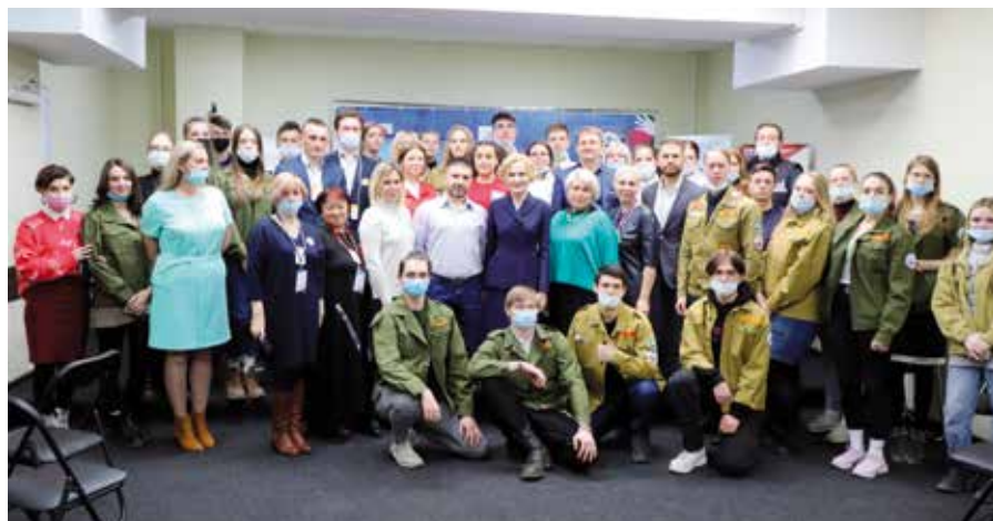
На встрече с волонтерскими организациями Камчатки обсудили помощь людям в пандемию