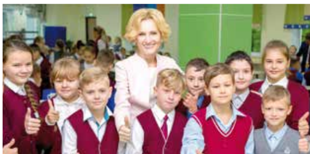
С учениками камчатской школы № 40

С подарками из Госдумы в гостях у воспитанников камчатского детского сада «Северяночка»