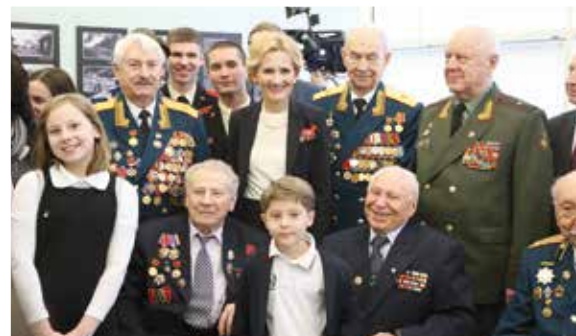
С ветеранами Великой Отечественной войны и их внуками на открытии выставки в Государственной Думе РФ