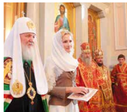
Святейший Патриарх Кирилл вручает орден Преподобной Евфросинии, великой княгини Московской, III степени

«Ирина Анатольевна Яровая – это человек с большой буквы, это подвижник всего передового, всего доброго, хорошего и прекрасного для нашего народа, для наших детей. Она не только государственный деятель, но и прекрасный человек, который понимает искусство, музыку, спорт. Она сейчас включилась в работу по сохранению наследия великого Николая Рериха, который завещал всю свою коллекцию картин и архивов России. В ненадлежащем виде хранились эти картины, в котором они были и из которого их убрали. Благодаря её усилиям эти картины сейчас хранятся в более-менее надлежащем виде. Спасибо огромное хочу выразить Ирине Анатольевне за ту колоссальную работу, которую она ведёт на благо России, на благо подрастающего поколения. Она полностью погружается в свою работу и делает всё на благо нашей страны – великой России».