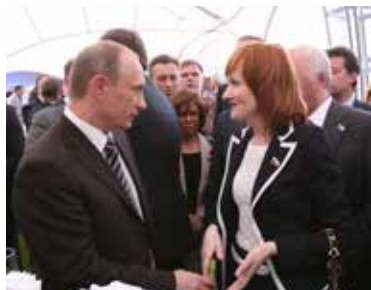
Встреча с Владимиром Путиным, на которой Ирина Яровая предложила ввести субсидированные перелёты на Камчатку