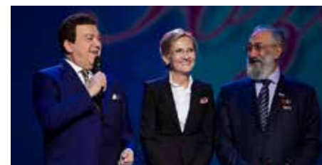
С уважаемыми коллегами Иосифом Кобзоном и Артуром Чилингаровым на премии «Щит и роза», которая вручается лучшим по профессии сотрудницам силовых министерств и ведомств