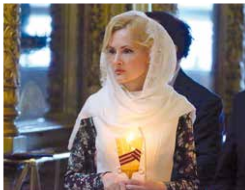
«Свеча памяти» в Елоховском соборе в Москве

В 2020 году в память о героях Великой Отечественной войны было зажжено свыше 28 млн свечей. То есть мы почтили память каждого из 27 млн погибших, кто отдал жизнь в той страшной войне.