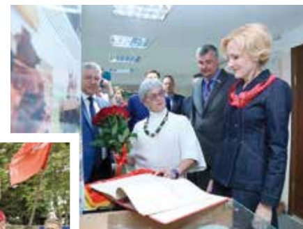
Посещение музея «Курильского десанта»

«Особую роль в реализации задуманного сыграла Ирина Анатольевна Яровая, чья неоценимая помощь пробивала все самые крепкие административные и организационные барьеры на нашем пути, а на Крымском полуострове даже в самых отдалённых посёлках местные жители знали о том, с какой миссией мы к ним приехали, и радушно нас принимали. Личный состав экспедиции выражает искреннюю благодарность и признательность нашему депутату».