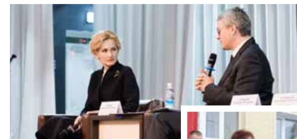
С Владимиром Солодовым на встрече с молодёжью и крупнейшими работодателями Камчатского края