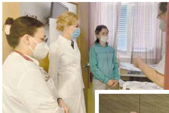
С ведущими врачами Центра им. Д. Рогачёва в палате у маленького пациента с Камчатки

С первым заместителем руководителя Администрации Президента РФ Сергеем Кириенко и генеральным директором Цentra им. Д. Рогачёва на Конгрессе, посвященном 10-летию Центра