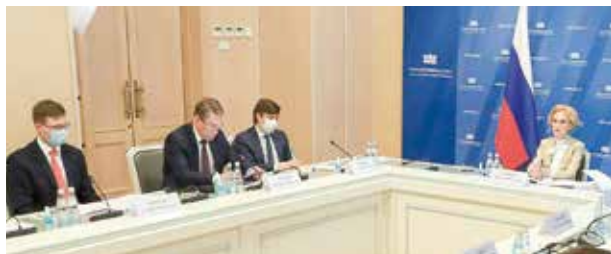
На заседании Президиума Совета законодателей с участием министра просвещения и министра здравоохранения

Ирина Яровая вместе с родителями и педагогами инициирует вопрос единства образовательного пространства, чтобы каждому ребёнку, независимо от социального статуса семьи, был гарантирован золотой стандарт качества образования. Больше которого дать можно, а меньше – нельзя.