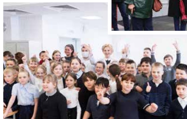
С учениками елизовской школы