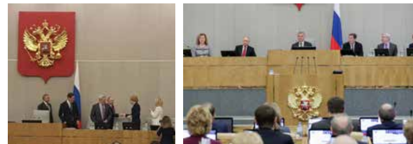
Президент РФ на пленарном заседании Государственной Думы