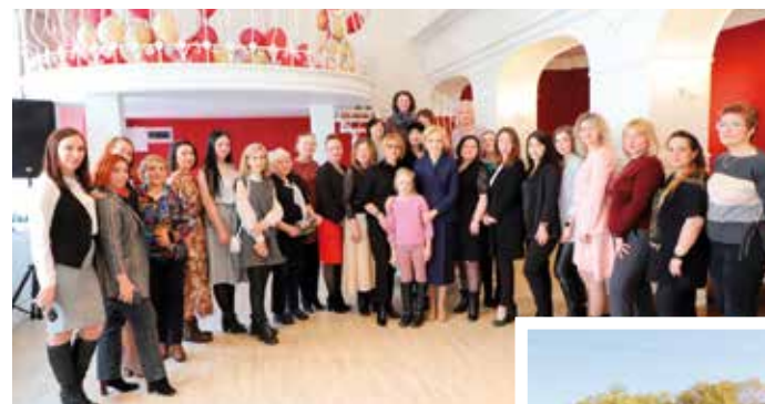
Союз женщин Камчатки благодарил Ирину Яровую за поддержку семьи и детства

Кроме того, предлагается создать механизм выплаты компенсаций на приобретение жилья людям, проживающим в сейсмоопасных домах и домах, подлежащих сносу.