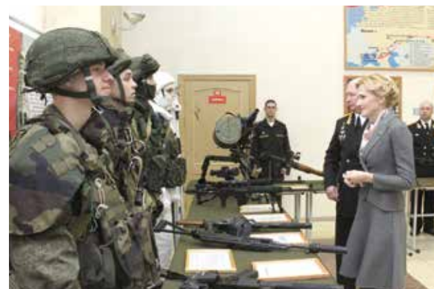
В воинской части на Камчатке