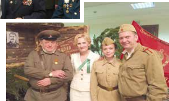
Выставка, посвящённая Дню партизана в Государственной Думе РФ