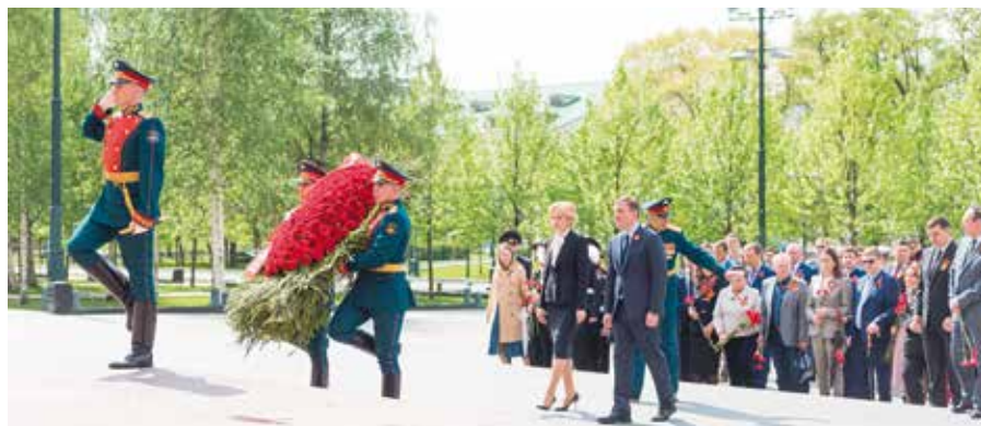
Возложение венков к Могиле Неизвестного Солдата в Александровском саду

Закон стал одной из составляющих государственного курса на противодействие фальсификации истории с опорой на общепризнанные принципы и нормы международного права.