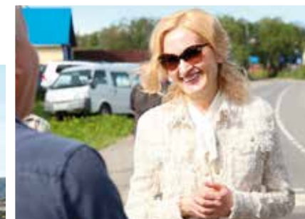
Посещение отремонтированной дороги в посёлке Николаевка