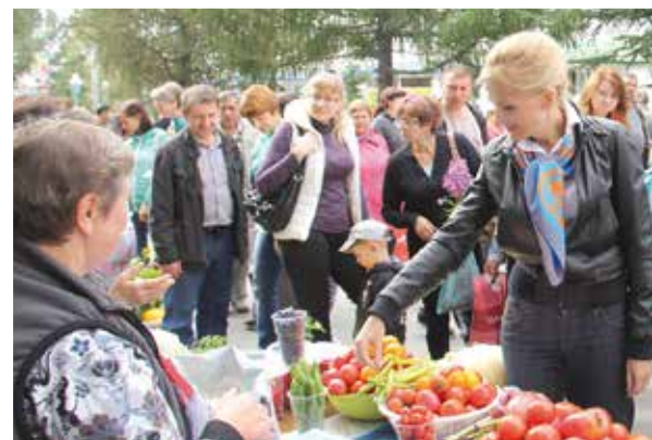
Ярмарка местных продуктов в Камчатском крае

«3 июля 2016 года состоялось знаменательное событие: было подписано президентом изменение в закон «О государственном регулировании торговой деятельности в РФ». Закон был внесён Ириной Анатольевной Яровой. В законе заложено главное – чтобы права малого бизнеса, российских производителей были защищены, гарантированы. Она этого добилась».