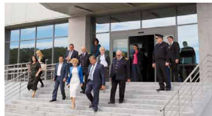
На морском вокзале