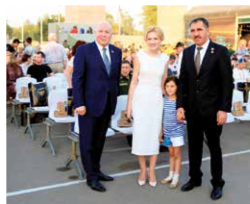
С секретарём Союзного государства России и Белоруссии Дми- трием Мезенцевым и заместителем министра обороны РФ Юнус-Бекком Евкуровым