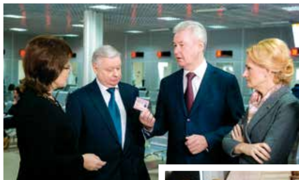
Посещение миграционного центра с мэром Москвы Сергеем Собяниным

На открытии выставки, посвящённой Москве, в Государственной Думе с председателем ГД Вячеславом Володиным, мэром Москвы Сергеем Собяниным и руководителем фракции ЕР Сергеем Неверовым