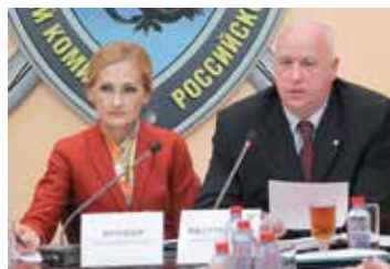
С главой Следственного комитета РФ Александром Бастрыкиным