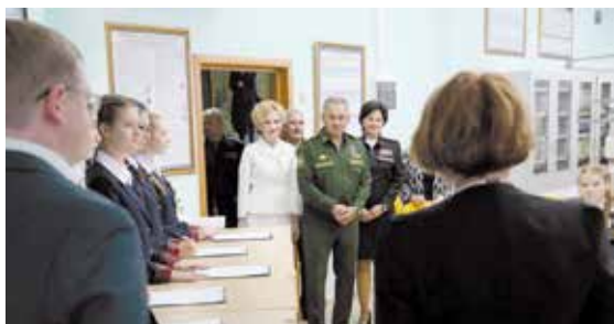
1 сентября в Пансионе воспитанниц Министерства обороны РФ. С министром обороны РФ Сергеем Шойгу

Воспитанницами Пансиона являются дети военнослужащих, проходящих военную службу в отдалённых военных гарнизонах, из неполных и многодетных семей, дочери погибших военнослужащих и участников боевых действий, награждённых государственными наградами за выполнение воинского долга.