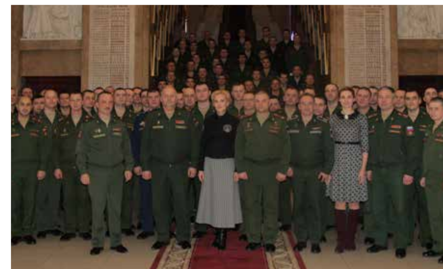
Со слушателями Академии Генштаба Минобороны РФ