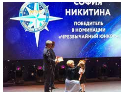
Награждение юных героев: Всероссийский фестиваль «Созвездие мужества», проводимый МЧС России