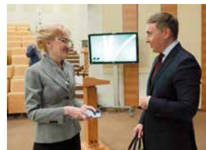
С министром науки и высшего образования Валерием Фальковым