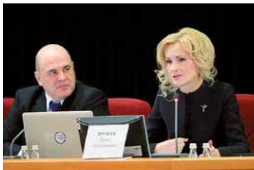
С председателем Правительства РФ Михаилом Мишустиним