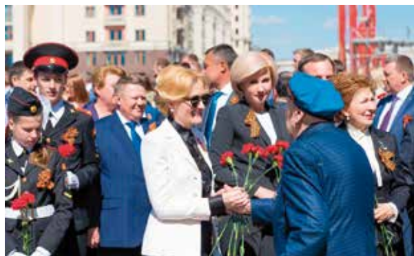
С уважаемыми ветеранами перед церемонией возложения цветов к памятнику Георгию Жукову

«Сообщаю, что по распоряжению главнокомандующего войсками национальной гвардии РФ сотрудники территориального органа Росгвардии оказали мне содействие в получении военного билета офицера запаса с записью в разделе «Оружие» о разрешении ношения кортика, что позволяет мне право на его хранение и ношение. Большое спасибо Вам за Вашу заботу и отзывчивость к рядовым гражданам, Вашим избирателям!»