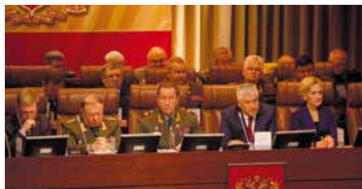
На итоговом заседании военного совета МВД РФ