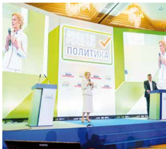
Выступление на открытии одного из полуфиналов конкурса «Лидеры России. Политика»