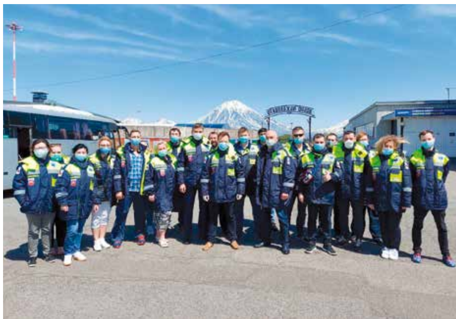
Спасительный десант московских врачей прилетел на Камчатку