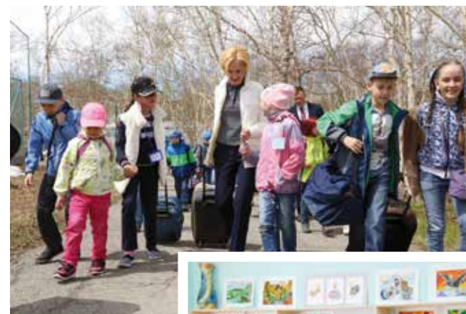
На открытии смены в камчатском загородном лагере «Волна»