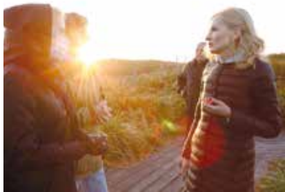
На Халактырском пляже

Погрузка проб с Халактырского пляжа в аэропорту Петропавловска-Камчатского для отправки в Москву