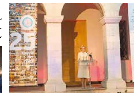
Российская делегация конференции «Политика безопасности ОБСЕ – взгляд со стороны женщин» в Вене