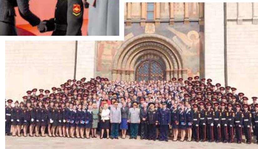
Выпускной суворовского училища в Кремле