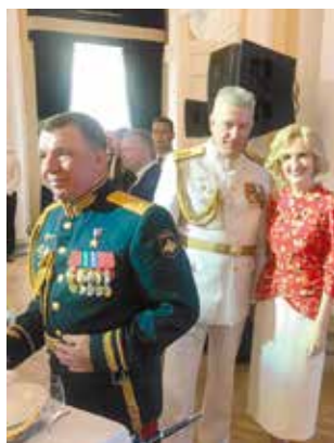
С главнокомандующим Военно-морским флотом РФ – адмиралом Николаем Евменовым