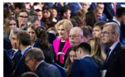
На съезде партии «Единая Россия»