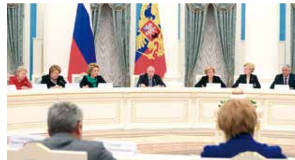
На заседании Совета при президенте по защите семьи и детей