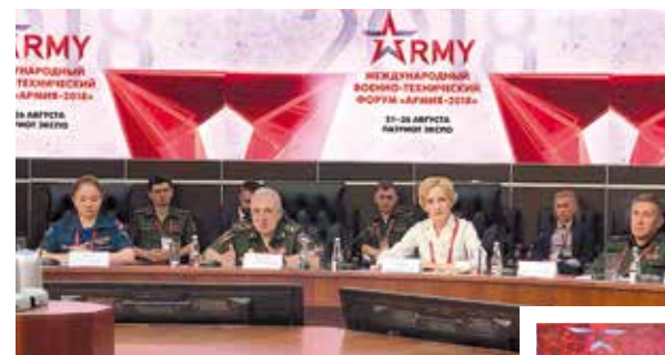
На международном военно-техническом форуме «Армия России» с первым заместителем министра обороны РФ Русланом Цаликовым