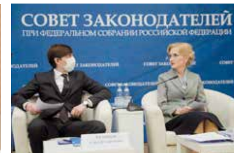
С министром просвещения РФ Сергеем Кравцовым