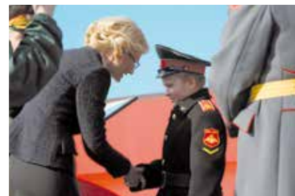
Присяга в Московском суворовском училище

Благодаря Ирине Яровой в законе появились понятия: «президентское кадетское училище», «суворовское военное училище», «нахимовское военно-морское училище», «кадетский (морской кадетский) военный корпус».