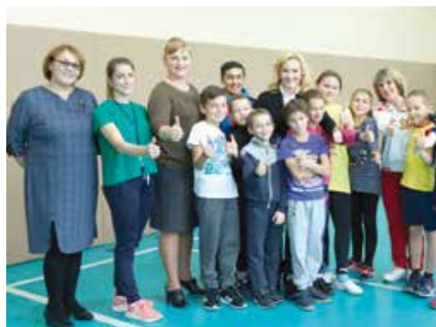
В школе посёлка Коряки Елизовского района