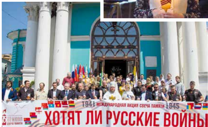
«Свеча памяти» у Елоховского собора в Москве