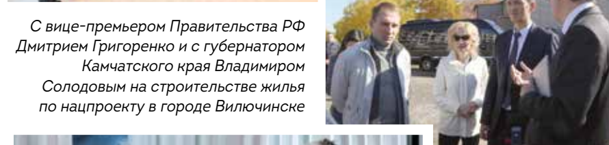
С вице-премьером Правительства РФ Дмитрием Григоренко и с губернатором Камчатского края Владимиром Солодовым на строительстве жилья по нацпроекту в городе Вилючинске