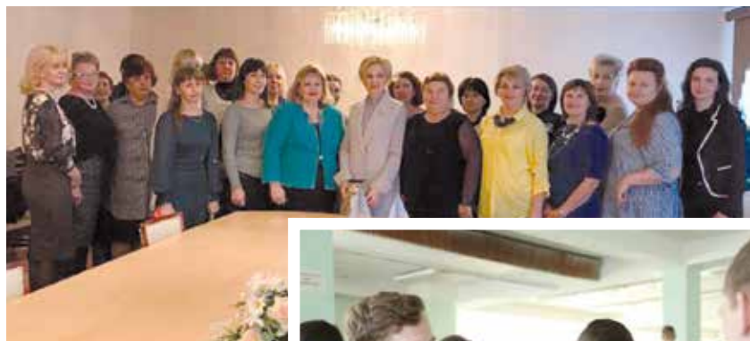
Встреча с педагогическим коллективом ДФАВТ

По просьбе Академии внешней торговли в интересах молодёжи края Ирина Яровая обратилась в Рособrnадзор и оперативно добилась открытия в дальневосточном филиале Академии внешней торговли магистратуры по направлению «Юриспруденция».