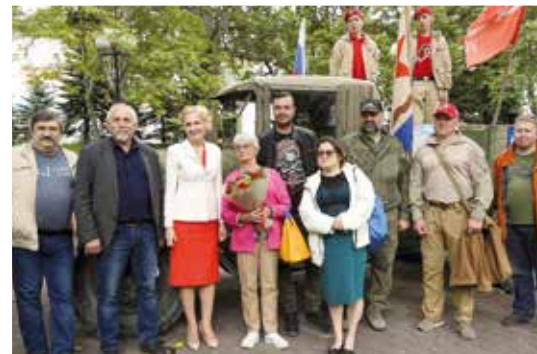
Встреча с участниками автопробега «От полуострова до полуострова. Камчатка – Крыму», совершённого на восстановленном фронтовом грузовике ЗИС-5