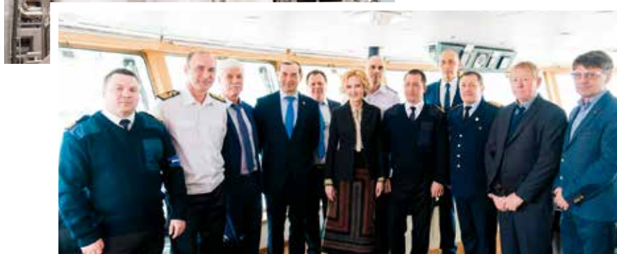
На борту судна «Василий Каплук»