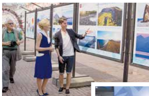
Открытие выставки победителей конкурса «Моя любимая Камчатка – приглашение к путешествию» на Арбате в Москве

По просьбе Ирины Яровой Правительство Москвы создало гид по Камчатскому краю на цифровой платформе глобального туристического сервиса RUSSPASS. Теперь жители России и всего мира могут в режиме «одного окна» спланировать своё путешествие на Камчатку и воспользоваться лучшими проверенными туристическими продуктами уникального края.