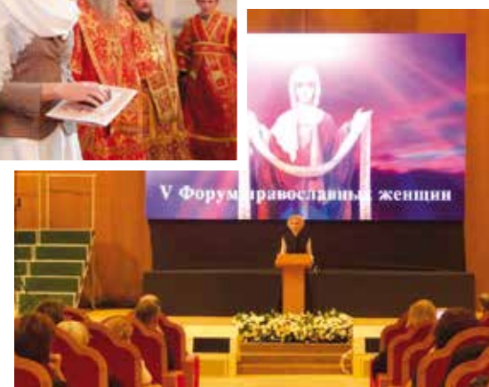
Выступление на V Форуме православных женщин