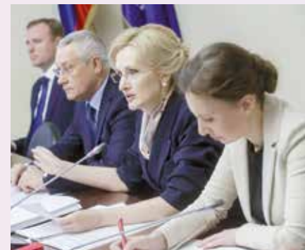
На заседании Экспертного совета с уполномоченным при Президенте РФ по правам ребёнка Анной Кузнецовой

«Уполномоченный по правам ребёнка очень тесно работает с Государственной Думой. Если даже перечислить последние темы, например вопрос безопасности детей в информационном пространстве. Одно время эта тема была поднята просто на пик, и мы понимаем, что требовались срочные решения. Здесь Ирина Анатольевна вышла с инициативой ввести уголовную ответственность за призывы к суициду в сети Интернет. И это было сделано, это правильный ход. Тема защиты детей от преступлений полового характера. Здесь мы видим жуткую статистику. Здесь безусловным ответом являются те предложения, которые заложены в законопроект, который разрабатывается под руководством Ирины Анатольевны Яровой».