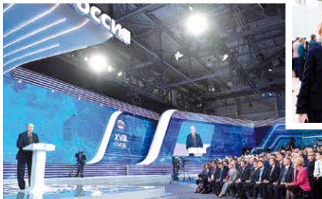
На съезде партии «Единая Россия»