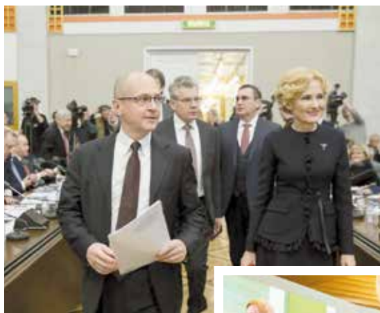
С первым заместителем руководителя Администрации Президента РФ Сергеем Кириенко

Сергей КИРИЕНКО, первый замглавы Администрации Президента РФ: «Ребята, у вас очень крутые наставники. Это наиболее успешные, наиболее опытные, наиболее талантливые и достойные люди, занимающиеся сегодня политикой в России. У них точно есть чему поучиться».